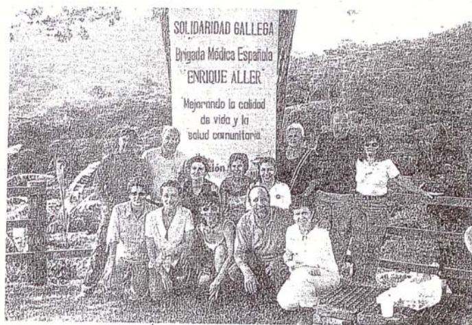
En Nicaragua reciben al equipo recordando al doctor Allier

más que sus compañeros que ya se encuentran en la región de Piura, de donde regresarán el próximo 21. Allí trabajan un oculista, un odontólogo, un ayudante médico y un coordinador, además de un intensivis-